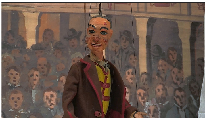
Fig 5. Particolare della marionetta Gianduja e del fondale utilizzato ( frame tratto dal video)