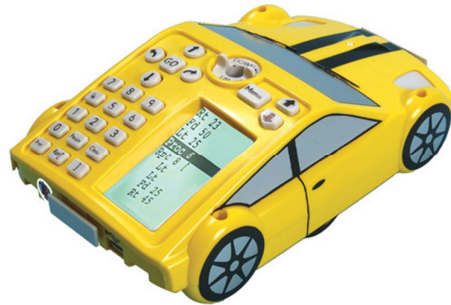
Fig. 2. Il mini-robot ProBot.