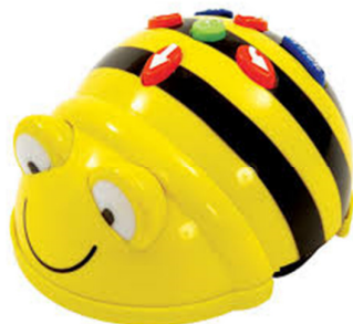
Fig. 1. Il mini-robot BeeBot.

Presso il nostro Laboratorio di robotica educativa , abbiamo sperimentato l'uso efficace di alcuni mini robot, in particolare BeeBot (Fig. 1) con alunni della scuola primaria e ProBot (Fig. 2) con alunni della secondaria di primo grado [5, 6, 7]. Mentre BeeBot si muove con passi di 15 cm avanti e indietro e ruota su se stesso di 90 gradi, a sinistra o a destra (nella versione più recente, chiamata BlueBot – Fig. 3 – è programmabile anche via smartphone, dispone del comando “ripeti” e può anche compiere angoli di 45°), ProBot incorpora il linguaggio Logo e – come la tartaruga di Papert 1 – può lasciare una traccia su di un foglio bianco e quindi disegnare figure geometriche o percorsi vari [2].