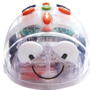
Fig. 3. Il mini-robot BlueBot, programmabile anche con lo smartphone.