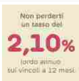
Widiba Zero Spese e 2,10%

1 porzione brucia fino a 1,8 kg di grasso della pancia! VEDI medicreporter.com