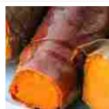
È l'antidoto all'obesità.

Scopri la Promo Maggio di Widiba: Tasso Annuo Lordo al Widiba.it/Conto-Corrente