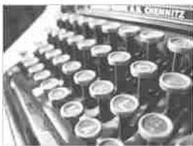
InnovaPugliaNews del 31/03/2016 >>