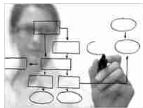
I Progetti in vetrina: EMPULIA>>