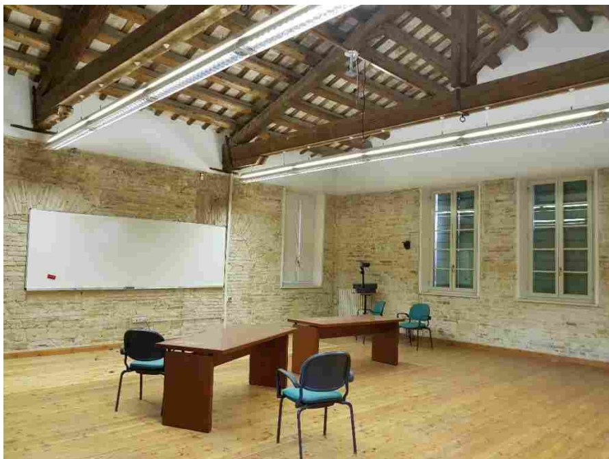
La più grande delle aule didattiche nelle ex scuderie recuperata dal sisma

Con l'occasione sono state visitate anche le Scuderie di Villa Favorita , oggetto di lavori di sistemazione in seguito al sisma del 2016 che ne aveva evidenziato criticità strutturali. Attualmente i locali, che erano utilizzati come aule didattiche sono interessati da due linee di lavoro: una che riguarda l'intervento alle fondazioni, finanziato da Banca d'Italia, che sarà ultimato entro 15 giorni, e l'altra sulle parti murarie, intervento finanziato dallo Stato che dovrebbe concludersi entro due mesi circa.