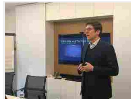
Citrix, un programma di canale tutto nuovo