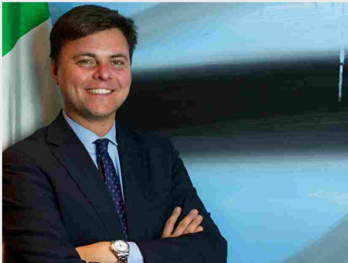
MARCO GAY , PRESIDENTE ANITEC-ASSINFORM

Anitec-Assinform – Associazione Nazionale delle imprese ICT e dell'Elettronica di Consumo – aderente a Confindustria e socio fondatore della Federazione Confindustria Digitale – è l'Associazione di settore di riferimento per le aziende di ogni dimensione e specializzazione: dai produttori di software, sistemi e apparecchiature ai fornitori di soluzioni applicative e di reti, fino ai fornitori di servizi a valore aggiunto e contenuti connessi all'uso dell'ICT ed allo sviluppo dell'Innovazione Digitale. Ha sede a Milano e Roma.