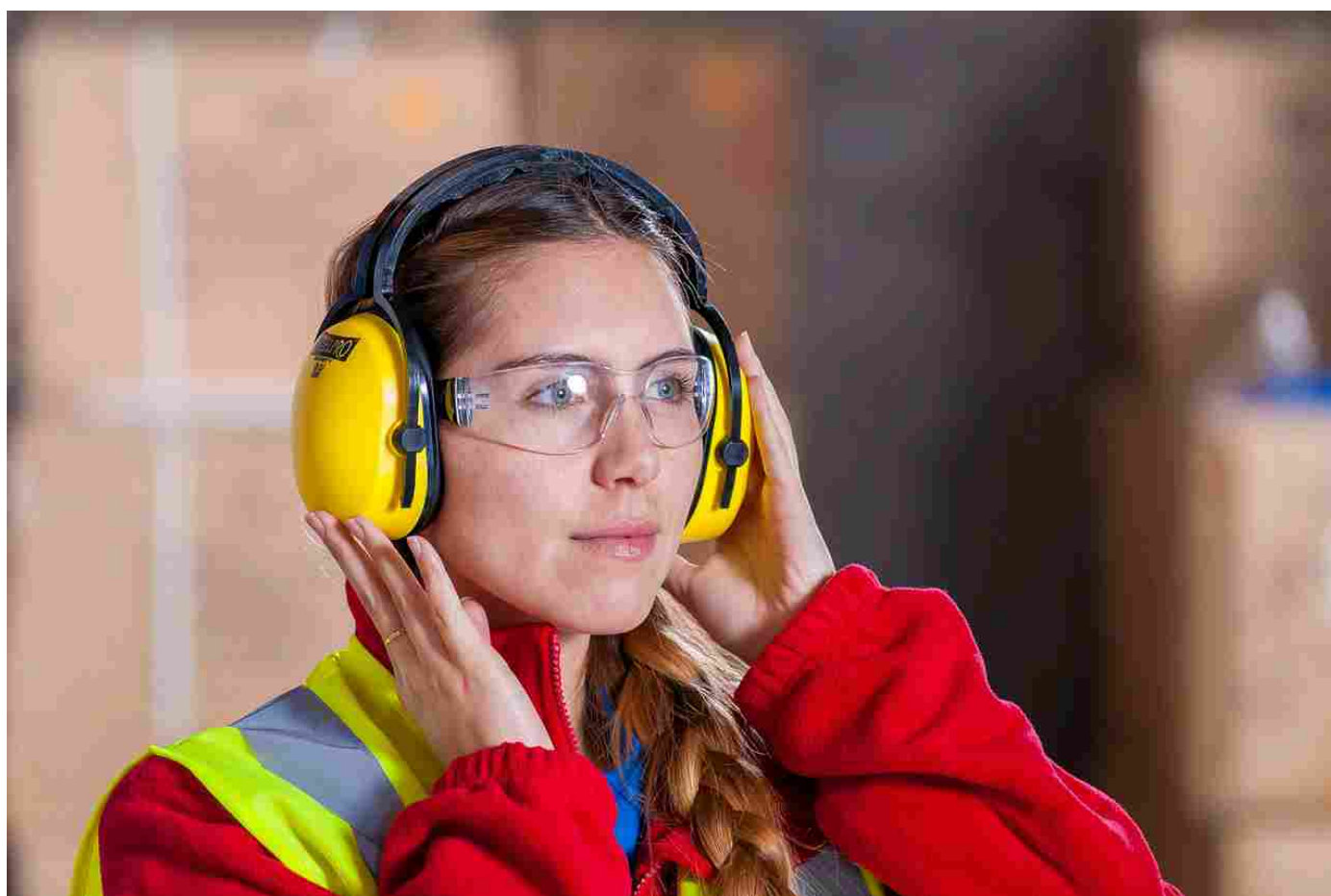
NELL'INDUSTRIA È PIÙ EVIDENTE IL FENOMENO DELLA CRESCITA DEGLI SKILL DIGITALI

Il percorso verso una maggiore consapevolezza dell'impatto del digitale sul valore del business non è ancora completato in diversi ambienti del management italiano, per motivi di ordine anagrafico, legislativo o semplicemente culturale. Ne risulta che è ancora troppo elevata la quota di aziende ed enti in cui la transizione al digitale è ancora a un livello troppo basso nella scala delle priorità strategiche rispetto all'effettiva urgenza, malgrado la quota crescente di competenze digitali richieste nelle funzioni direttive e manageriali.