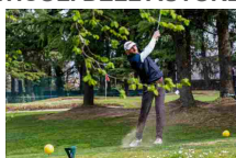
Imparare a fare l'impresa con lo sport