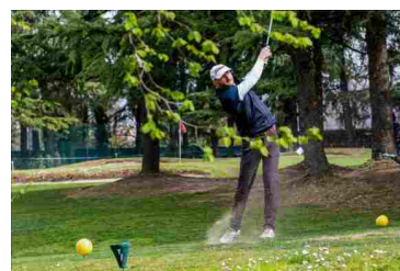
Imparare a fare l'impresa con lo sport