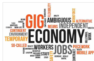
La Gig economy in Italia, ovvero il lavoro saltuario e a tempo.