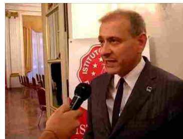
Torino - Superare i debiti con la legge 3/2012