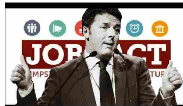
Lavoro: cosa ci lascia in eredità il Jobs Act di Renzi.