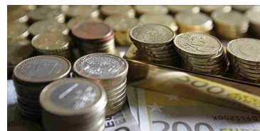
Le banche di territorio sono una ricchezza per il Sistema Italia