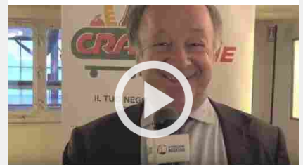
Crai si consolida e sbarca nell'e-commerce