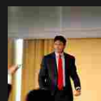
Il mondo dei Bitcoin chiuso e razzista? Redazione BitMAT - 27/07/2017