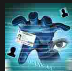
Il cybercrime costa all'economia globale quasi 600 miliardi di dollari Redazione BitMAT - 26/02/2018