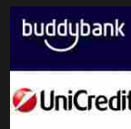
Buddybank, il nuovo modello di banca digitale powered by UniCredit Redazione BitMAT - 30/01/2018