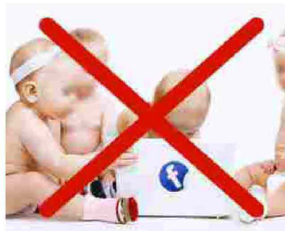
Foto dei figli sui social, è allarme pedopornografia

A Fossacesia il Comune invita i giovani a mangiare insieme...