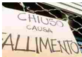
Il "Buon padre di famiglia" paga il