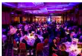
Italy Protection Awards: i premiati