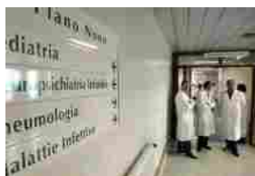
Unisalute: gli italiani promuovono il